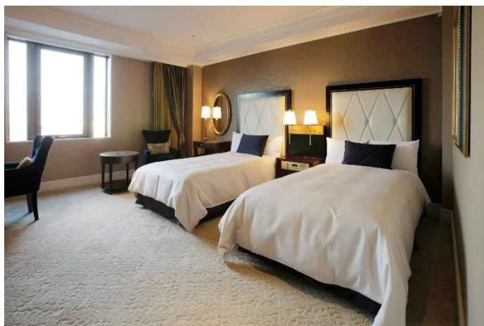
▲本館グランドデラックスツイン

■ホテルで過ごすひと時を華やかに彩るフラワーアレンジメントをお部屋へご用意いたします。(お持ち帰りいただくことができます。)