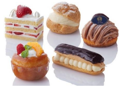
ショートケーキ シューアラクレーム モンブラン サヴァラン エクレール

オレンジの爽やかな甘さと口当たりの良いカスタードを合わせた色鮮やかなタルトです。