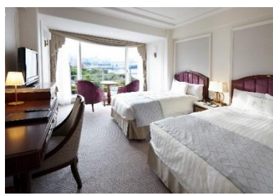
▲タワー館 スーペリアフロア ベイサイドツイン