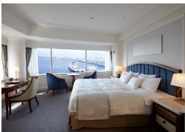
▲タワー館 スーペリアフロア ベイフロントコーナーダブル

“横浜時間”をコンセプトにした横浜港を一望できる多彩なお部屋からお選びいただけます。