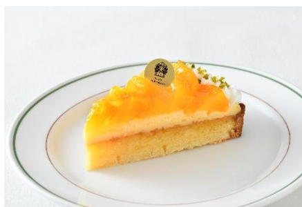
オレンジタルト(～4/30まで)

さっくりとしたダコワーズを土台に、生クリームと桜餡入りクリームをたっぷり重ねた春爛漫な一品。