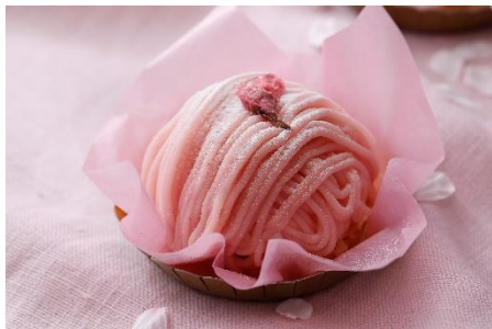
桜モンブラン(～4/10まで)

さっくりとしたダコワーズを土台に、生クリームと桜餡入りクリームをたっぷり重ねた春爛漫な一品。