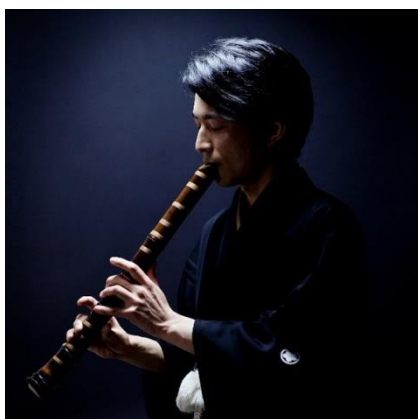
田中黎山(尺八演奏家)