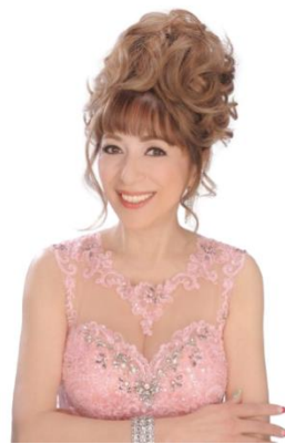
キャロル山崎(ジャズボーカリスト)