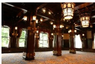
本館 2 階フェニックスルーム