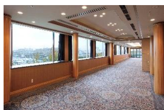
本館 5 階スターライトルーム