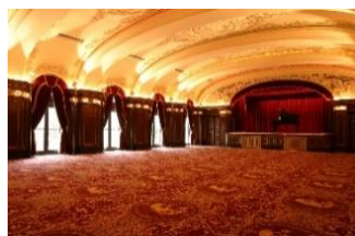
本館 2 階レインボーボールルーム