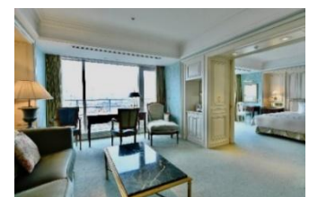
タワー館ブルミエスイート