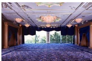
タワー館 3 階ベリール来航の間