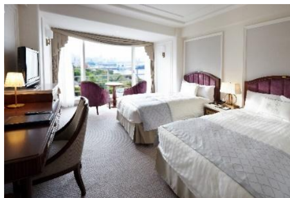
▲タワー館 スーペリアフロア ベイサイドツイン