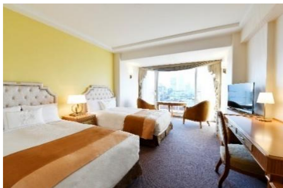
▲タワー館 グランドクラブフロア ツイン

昼は青く澄み渡る絶景、日没ごろには夕焼けに染まる街並み、夜には宝石を散りばめたかのような煌めく夜景と、刻々と変化する景色をご覧くださいることができます。