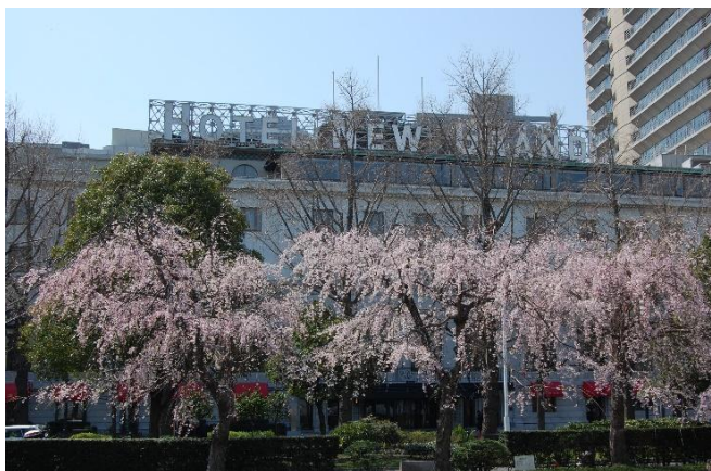
3月上旬頃(枝垂れ桜)