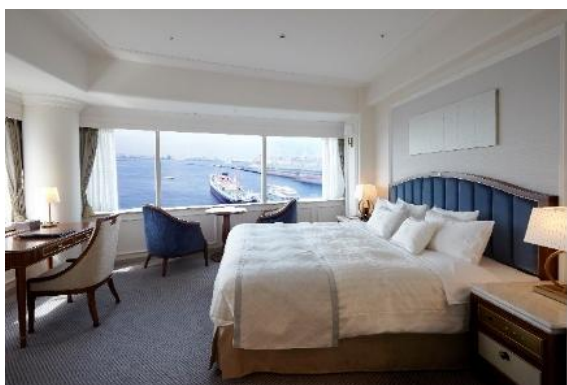
▲タワー館 スーペリアフロア ベイフロントダブル