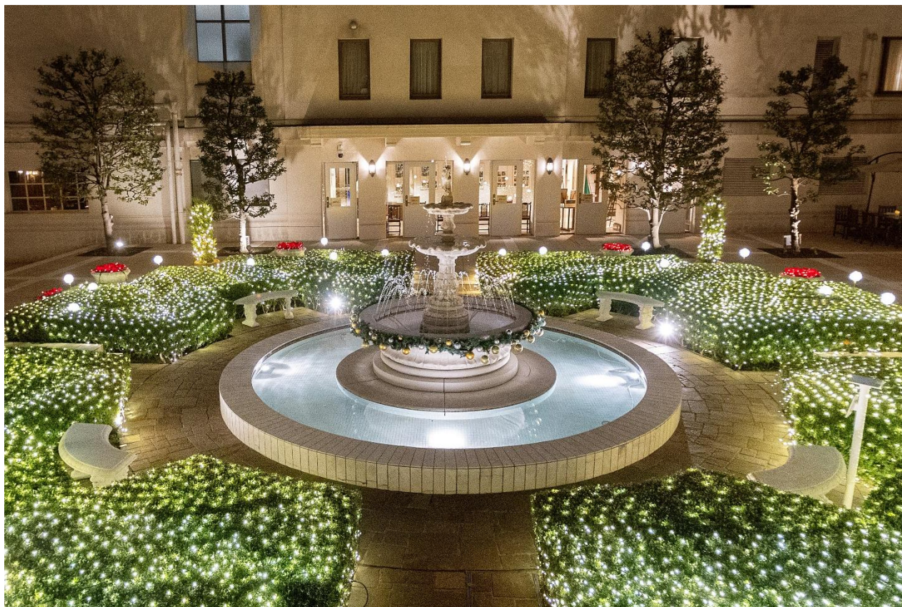
▲画像は 2024 年開催時の「光の庭園」

中央に噴水を配した緑あふれるヨーロッパ調の美しい庭園で、合計 1.5 万球の煌めくイルミネーションに包まれるロマンティックな空間をお楽しみいただけます。この時期ならではの、光や輝きに満ちた夢のような演出を、どうぞゆっくりとお楽しみください。