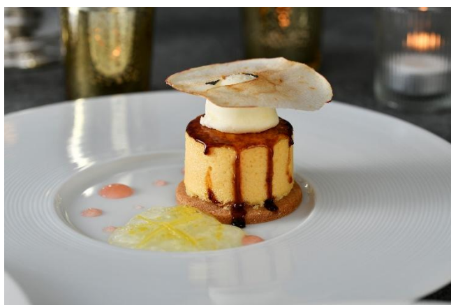
リンゴのシブースト レモンジュレとバニラアイス添えて