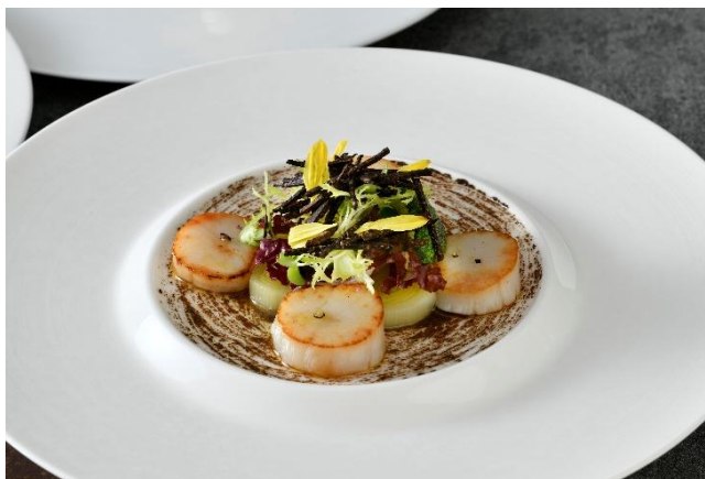
帆立貝とポワローのマリネ トリュフの香り