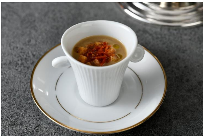
セップ茸のなめらかなヴルーテと鶏のロワイヤル チョリソ風味