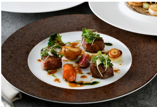
ピースにした国産牛ロース肉のグリル ロースト野菜とビーフのジュ